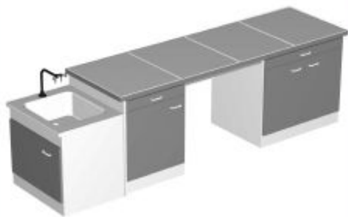
TABLE PROFESSEUR TYPE 4

*TABLE SÈCHE DE 1800 À 3000/750/900MM PLAN DE TRAVAIL SUR MEUBLES PORTEURS MEUBLE DE 600MM 1 TIROIR 1 PORTE 1 ÉTAGÈRE MEUBLE DE 900MM 1 TIROIR 2 PORTES 1 ÉTAGÈRE *PLOT TECHNIQUE DE 750/600MM HAUTEUR +750 OU 900MM PLAN DE TRAVAIL AVEC BAC SUR MEUBLE PORTEUR AVEC PORTE D'ACCÈS TECHNIQUE