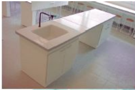
PLAN DE TRAVAIL GRÈS 8MM ET PPH TYPE 2