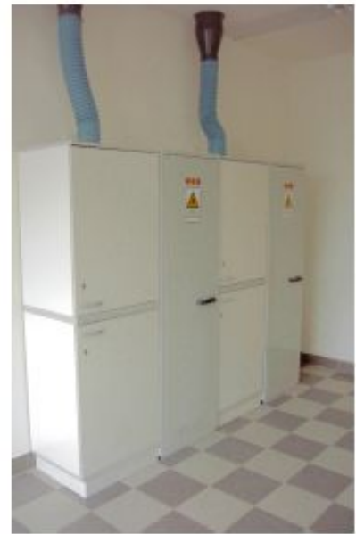
ARMOIRE DE STOCKAGE PRODUITS *DE SÉCURITÉ POUR SOLVANTS ET PRODUITS INFLAMMABLES *VENTILÉE POUR ACIDES ET BASES CAPACITÉS ET DIMENSIONS PAGE 22