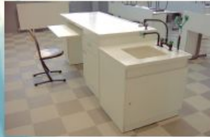
PLAN DE TRAVAIL DALLES DE GRÈS VITRIFIÉE 22M TYPE 3