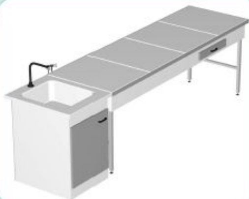
TABLE PROFESSEUR TYPE 1

*TABLE SÈCHE DE 1800 À 3000/750/900MM PLAN DE TRAVAIL SUR OSSATURE PORTEUSE BANDEAU DE 150MM AVEC TIROIR DE 300/120/450MM *PLOT TECHNIQUE DE 750/600MM HAUTEUR +750 OU 900MM PLAN DE TRAVAIL AVEC BAC SUR MEUBLE PORTEUR AVEC PORTE D'ACCÈS TECHNIQUE