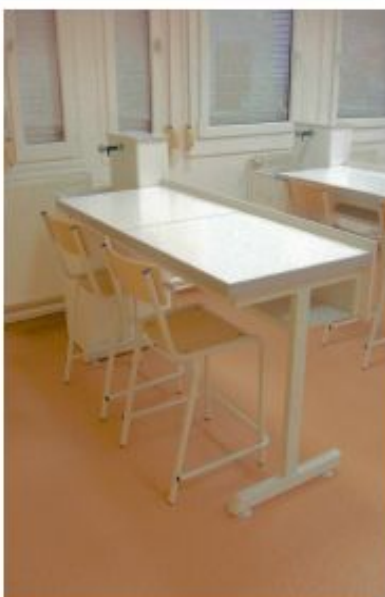
SIÈGES ASSISE BOIS VERNI SUR PIÈTEMENT ACIER REVÊTU ÉPOXY *TABOURET 4 PIEDS ASSISE CIRCULAIRE OU CARRÉ HT 58CM *CHAISE AVEC ASSISE ET DOSSIER FIXE *CHAISE AVEC ASSISE ET DOSSIER RÉGLABLES