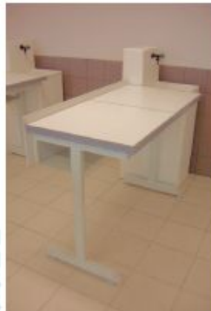
TABLE 2 ÉLÈVES 1200MM PLAN GRÈS 8MM AVEC COLONNE ÉNERGIES RÉSINES MOULÉES