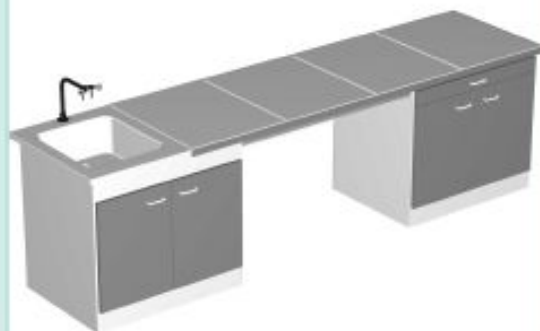
TABLE PROFESSEUR TYPE 3

*TABLE HUMIDE DE 1800 À 3600/750/900MM PLAN DE TRAVAIL SUR MEUBLES PORTEURS PLAN DE TRAVAIL SEC PLAN DE TRAVAIL HUMIDE AVEC BAC MEUBLE DE 900MM 2 PORTES SOUS BAC MEUBLE DE 900MM 1 TIROIR 2 PORTES 1 ÉTAGÈRE