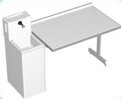
TABLE TYPE CEF

*TABLE SÈCHE DE 1200 À 1800/620/900MM PLAN DE TRAVAIL AVEC DOSSERET SUR OSSATURE PORTEUSE *COLONNE «ÉNERGIE» DE 400/600/900/1200MM PLAN RÉSINE MOULÉE REVÊTU GELCOAT SUR CAISSON PORTEUR AVEC TRAPPE AVEC CUVETTE 300/300/200MM FONTAINE DE 400/150/300MM