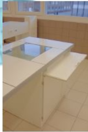
AGENCEMENT POUR MULTIMÉDIA « EXAO » TYPE 4