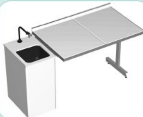
TABLE TYPE PTE

*TABLE SÈCHE DE 1200 À 1800/620/900MM PLAN DE TRAVAIL AVEC DOSSERET SUR OSSATURE PORTEUSE *PLOT «ÉNERGIE» DE 400/600MM HAUTEUR DE 750 À 900MM PLAN TRESPA 16MM SUR CAISSON PORTEUR AVEC TRAPPE AVEC CUVETTE PPE 300/300/200MM