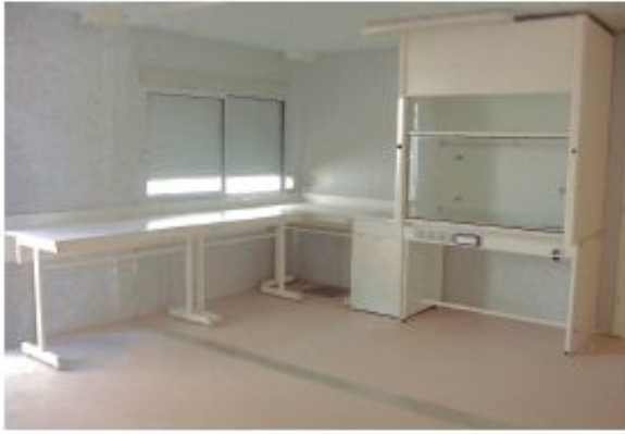
SORBONNE DE MANIPULATION SIMPLE ACCÈS CARACTÉRISTIQUES PAGE 26