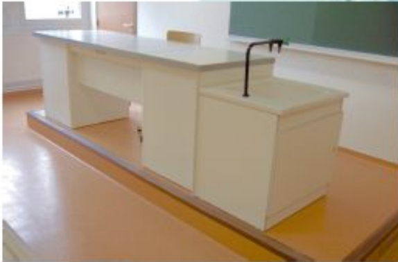
PLAN DE TRAVAIL GRÈS 8MM ET PLAN SURBAISSE DALLE DE GRÈS ÉMAILLÉE 30MM TYPE 3